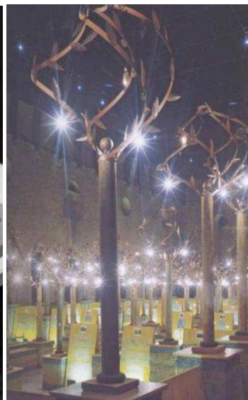
Mostra "Gabetti e Isola", Basilica palladiana, Vicenza, 1995-96